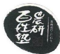
千歳アンテナショップ